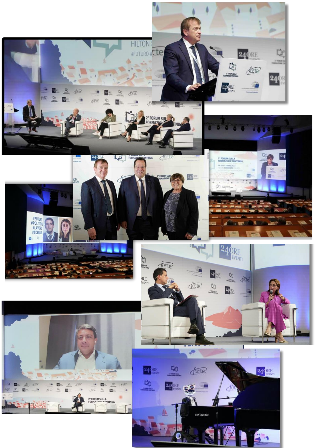
"I video, l'intera galleria dell'evento e la rassegna stampa sono pubblicati sul sito Istituzionale del Fondo"